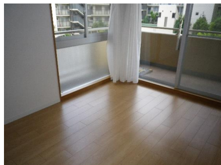
※図面と現況が異なる場合は、現況を優先します。