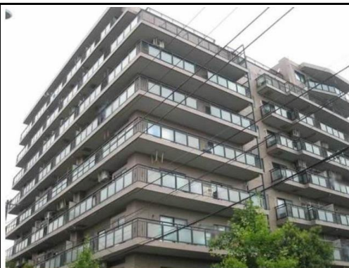
マイキャッスル梅島アーバンステージ