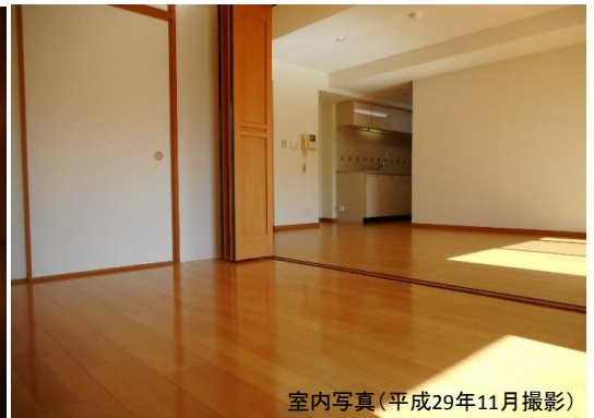
室内写真(平成29年11月撮影)