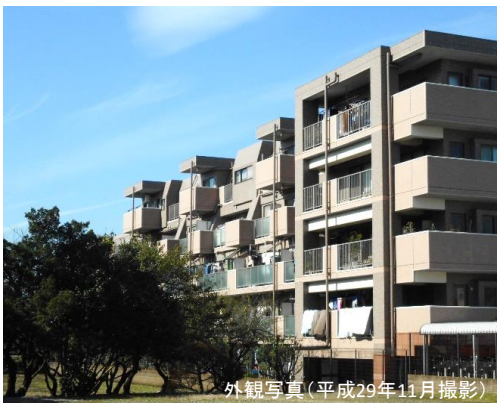
外観写真(平成29年11月撮影)