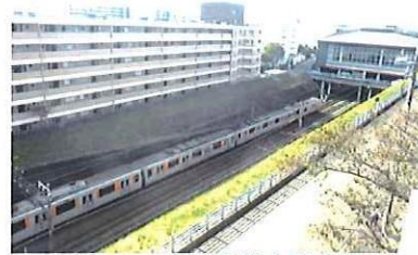
バルコニーから青葉台駅方向

専有面積(壁芯)72.46㎡(21.91坪) バルコニー 7.66㎡(2.31坪)