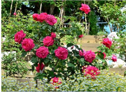
藤が丘駅前公園のバラ