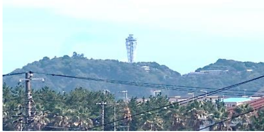
リビングから撮影 江ノ島灯台17/8/8