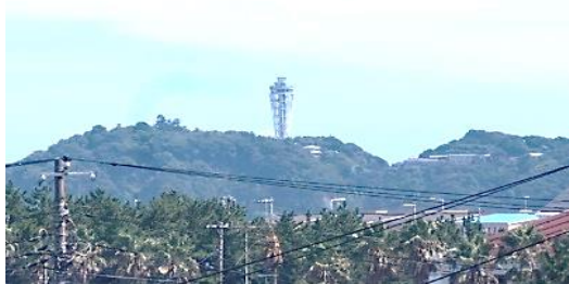
リビングから撮影 江ノ島灯台17/8/8