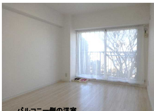
バルコニー側の洋室