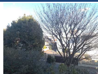
東側バルコニーより 2018・1・6撮影