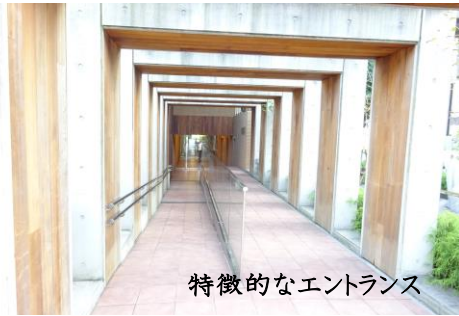
特徴的なエントランス

TVモニター付非接触型オートロック、宅配BOX、平成21年築「新耐震基準」マンション、菱重エステート旧分譲