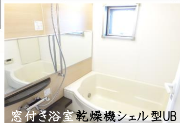
窓付き浴室乾燥機シェル型UB