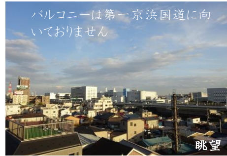
バルコニーは第一京浜国道に向いておりません