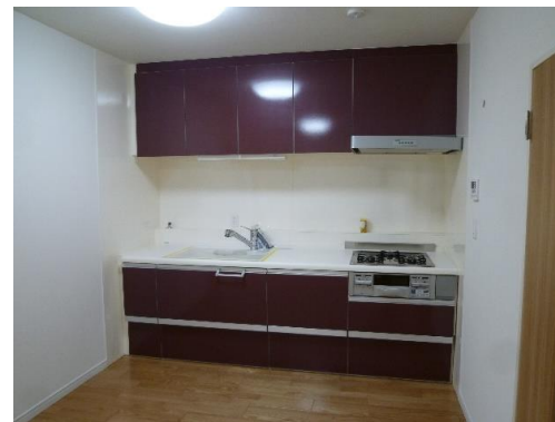
※図面と現況が異なる場合は、現況を優先します。