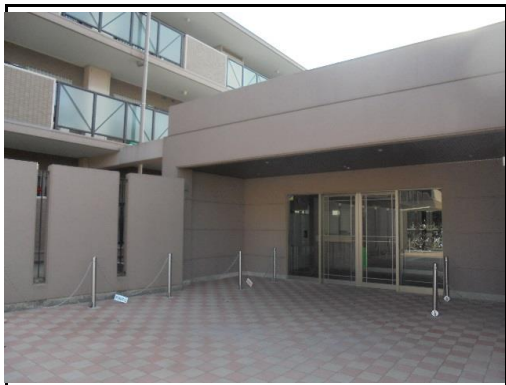
ライオンズマンション光が丘公園

3,880 万円 (税込) 3LDK [ 213号室 ] 専有面積 (壁芯) 63.22 ㎡ (約19.12坪) バルコニー面積 9.33 ㎡ (約2.82坪)