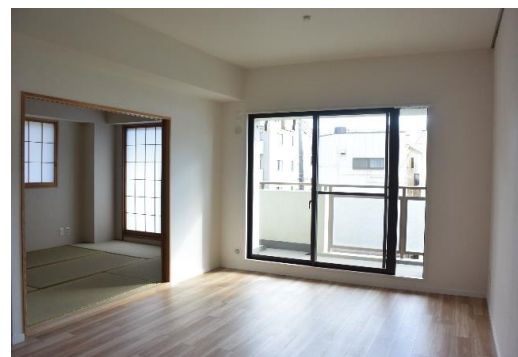
※図面と現況が異なる場合は、現況を優先します。