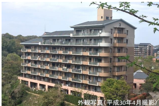
外観写真(平成30年4月撮影)