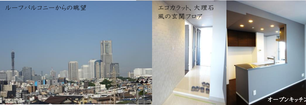
ルーフバルコニーからの眺望

平成22年築新耐震マンション、閑静な住宅街立地、ルーフバルコニーより横浜駅、みなとみらいを一望