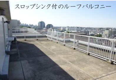
スロップシンク付のルーフバルコニー