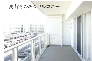
奥行きのあるバルコニー

コンシェルジュサービス: クリーニング取次、宅配便取次、タクシー配車等 共用施設: 集会室、ラウンジホール、専用駐車場等